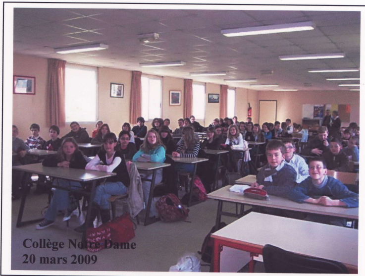
Collège Notre Dame 20 mars 2009

105, rue Carnot 59150 Wattrelos Tel : 03 20 82 99 83 Portable : 06 61 32 22 97 e.mail : salvacalva@wanadoo.fr www.touscan.org