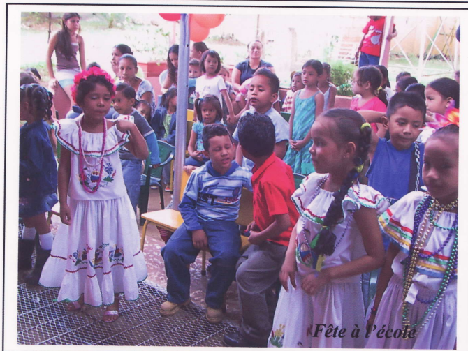
Fête à Pécole

Un grand merci encore ! L'équipe des bénévoles de TouSCAN