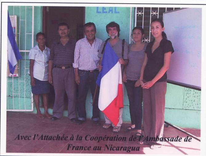
Avec l'Attachée à la Coopération de l'Ambassade de France au Nicaragua

Voici quelques photos prises à l'école « Rayito de Sol - Sodelba Leal ». Pour votre information sur l'activité de TouSCAN, nous joignons également à ce courrier le petit journal de notre association.